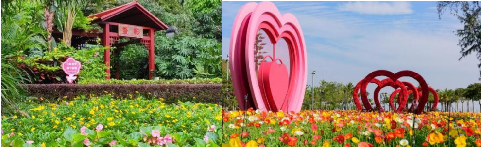
图注：五一期间景观，白莲洞公园（左）野狸岛公园（右）

高质量完成花展及摆花任务，在元旦、春节、五一、国庆、航展等重大节日装扮公园与道路，种植摆放大量时花，打造多处主题景点，美化城市环境，营造浓厚节日氛围。2024年共种植和摆放时花约3.6万平方米。