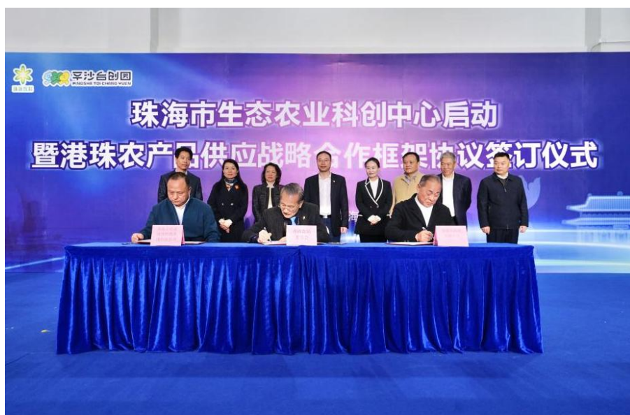
图注：港珠农产品供应战略合作框架协议签订仪式

12月24日，珠海生态农业科创中心在珠海市金湾区台创园二期核心区蝴蝶中心启动。活动现场，珠海农控集团与香港食品委员会、香港新农人集团签订港珠农产品供应战略合作框架协议，港珠农产品供应战略合作开启新篇章。