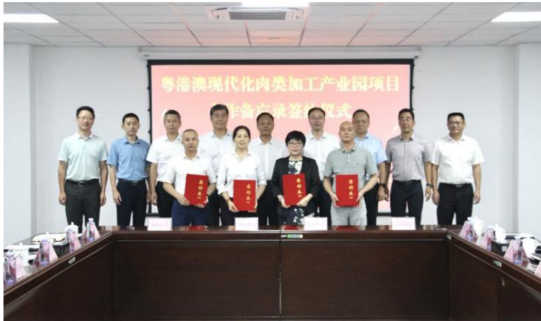
图注：粤港澳现代化肉类加工产业园项目合作备忘录签约仪式