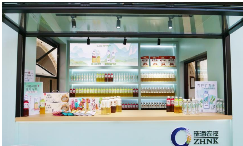
图注：农控集团新茶饮横琴快闪店

打造黔货特色产品，创新模式实现品牌焕新。充分利用遵义凤冈、赤水特色资源，打造农控品牌矿泉水、纸巾系列产品，创新推进“黔货出山 遵品入珠”合作模式。完成采购销售贵州活牛、红缨子高粱、辣椒等农产品 6.07 亿元，超额提前完成市委下达的 1.8 亿元东西部协作消费帮扶任务。在 2024 年第 15 届航空航天博览会上，珠海农控集团以“云端之上 山海与茶”为主题，携手本地雾鲜品牌在珠海国际航展中心休闲大草坪设立了珠海农控 - 雾鲜联名航展快闪店。