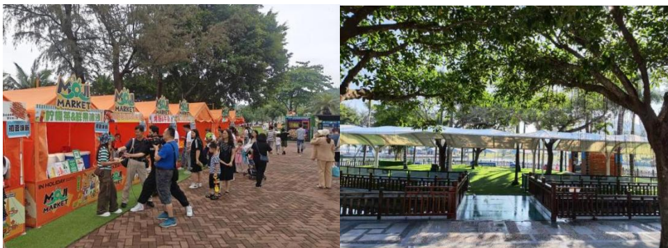
图注：海滨公园特色活动

通过探索公园场景经济、假日经济及周末经济等多元模式，利用公园资源推出系列特色主题活动，各市属公园联合属地单位围绕多主题开展 46 场文体科普活动，约 1.5 万人参与；协助开展 9 场义务植树活动，种植苗木 303 株，丰富市民文化生活，增强公众生态环保意识。提升公园的人气，并与周边商家合作打造消费生态圈，促进资源共享与互利共赢。