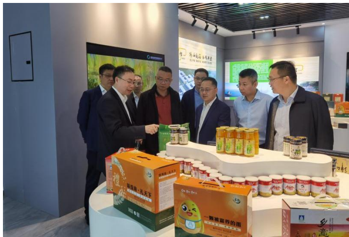
图注：珠海农控集团赴遵义调研东西部协作和对口合作工作