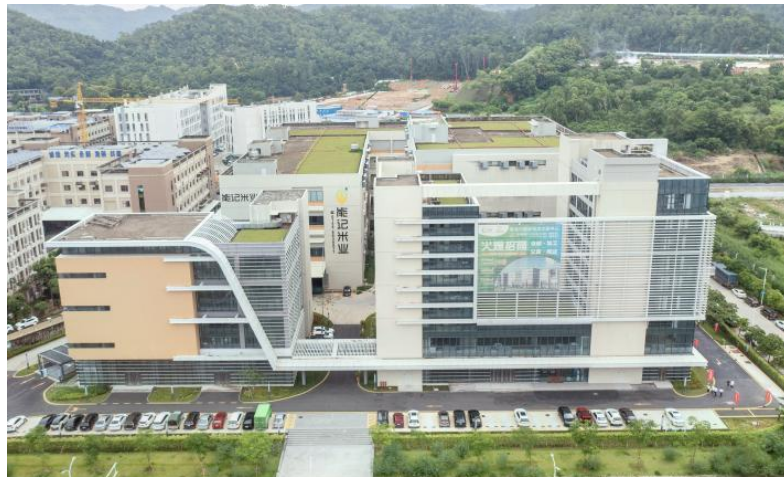
图注：粮食物流交易中心