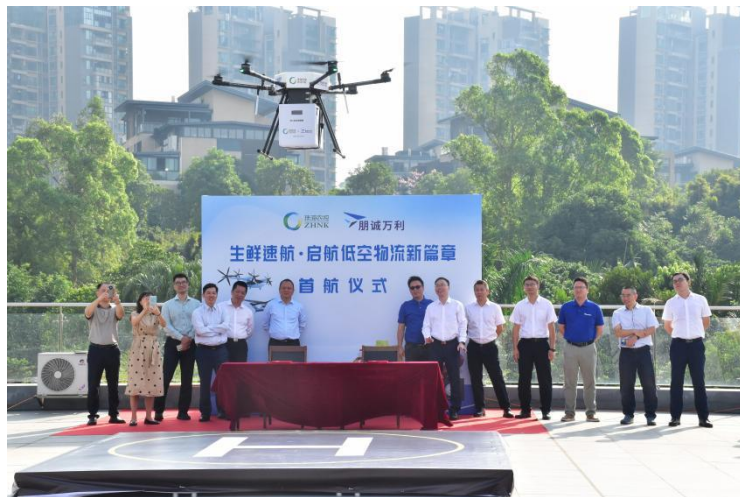
图注：无人机生鲜速递服务首航仪式

11月5日，鹤洲南垦区生态治理一期项目顺利竣工。仅用时30天，鹤洲南26平方公里围垦区焕然一新，实现了翻天覆地的变化，初步呈现出人与自然和谐共生的生态面貌。