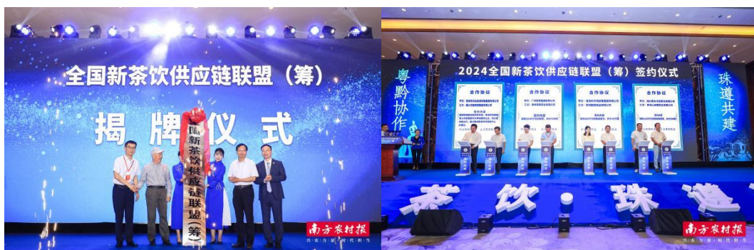
图注：全国新茶饮供应链联盟（筹）揭牌仪式（左）签约仪式

5月13日,珠海遵义共同打造“全国新茶饮供应链中心”战略启动仪式活动在遵义市湄潭县举行。这标志着珠遵两地纵深推进产业合作,因地制宜培育新质生产力,开启了又一重要新篇章。9月25日,2024全国新茶饮供应链联盟(筹)成立大会在遵义市湄潭县举行。珠遵新茶饮研究院暨战略咨询专家委员会、全国新茶饮供应链联盟(筹)揭牌,标志着珠遵两地共同打造的新茶饮供应链产业新生态迈出关键步伐,助力全国新茶饮供应链提质升级和新茶饮产业高质量发展。